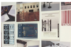
32+1 CARTES POSTALES COLLECTION MJS (PARIS)