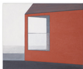
ATELIER BELGE acrylique sur toile de lin • 49 x 55 cm 2015