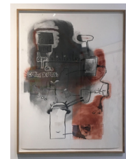
POUR UNE DÉPOTENTIALISATION DES CONNEXIONS fusain sur papier • 82 x 62 cm 2011