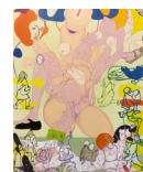
HANS BELLMER acrylique sur toile • 80 x 60 cm 2017