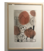
CE QUI RESTE ENCORE fusain sur papier • 57 x 47 cm 2011