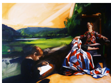
UN JOUR VIENDRA huile sur toile • 97 x 130 cm 2017