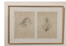
LES LARMES D'ÉROS graphite sur papier millimétré • 30 x 42 cm 2017