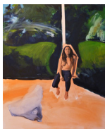
DRESSEUSE huile sur toile • 130 x 97 cm 2017