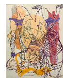
HANS BELLMER acrylique sur toile • 80 x 60 cm 2017