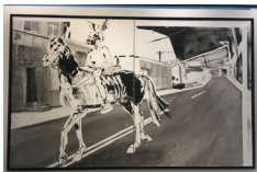
EASTERN techniques mixtes sur papier • 151 x 232 cm 2017