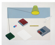
REWIND 73 acrylique sur toile de lin • 80 x 100 cm 2018