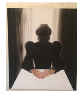
RÜCKKEHR huile sur toile • 130 x 97 cm 2009