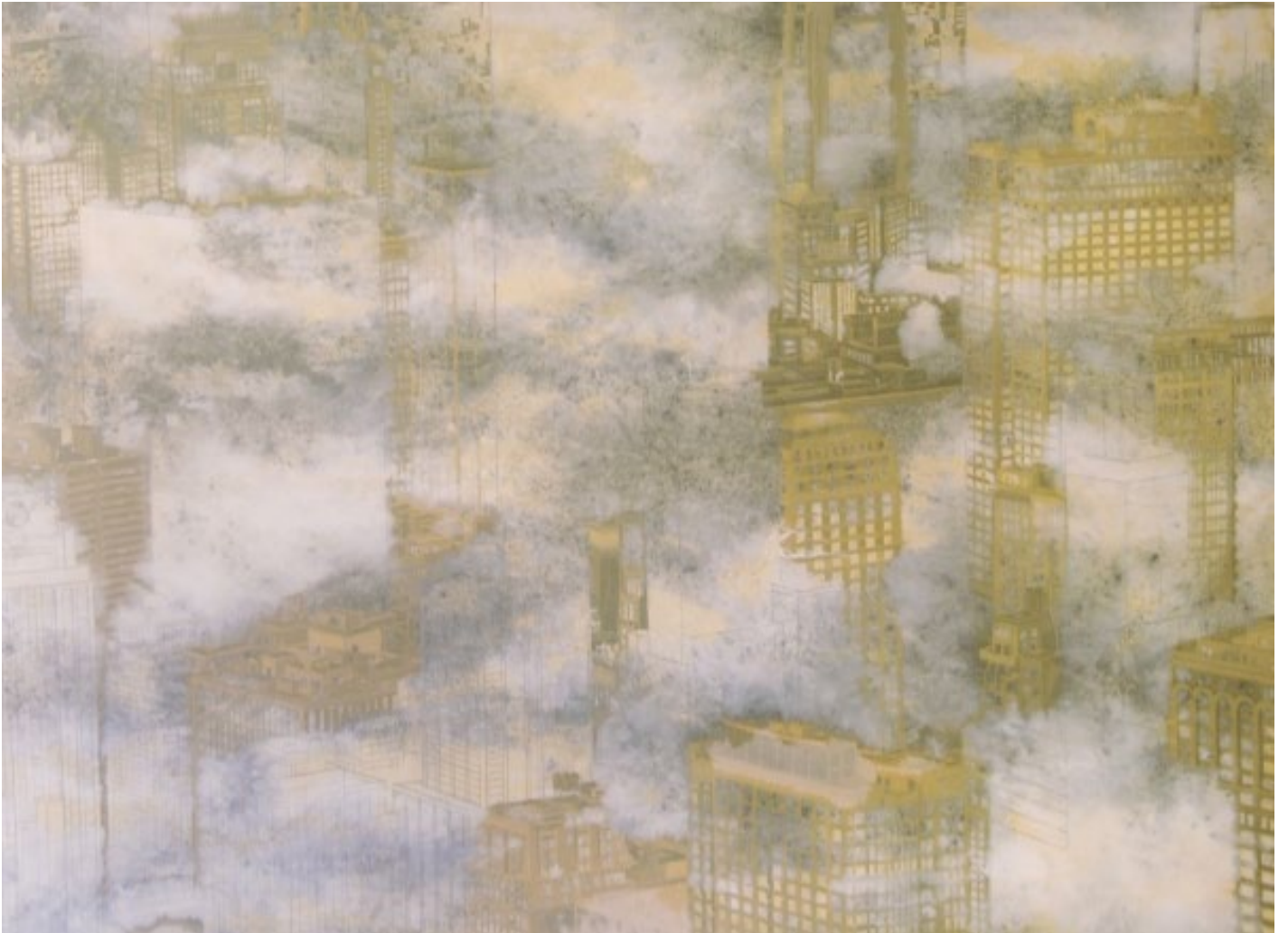
Morning Towers huile sur toile 81x65cm 2008