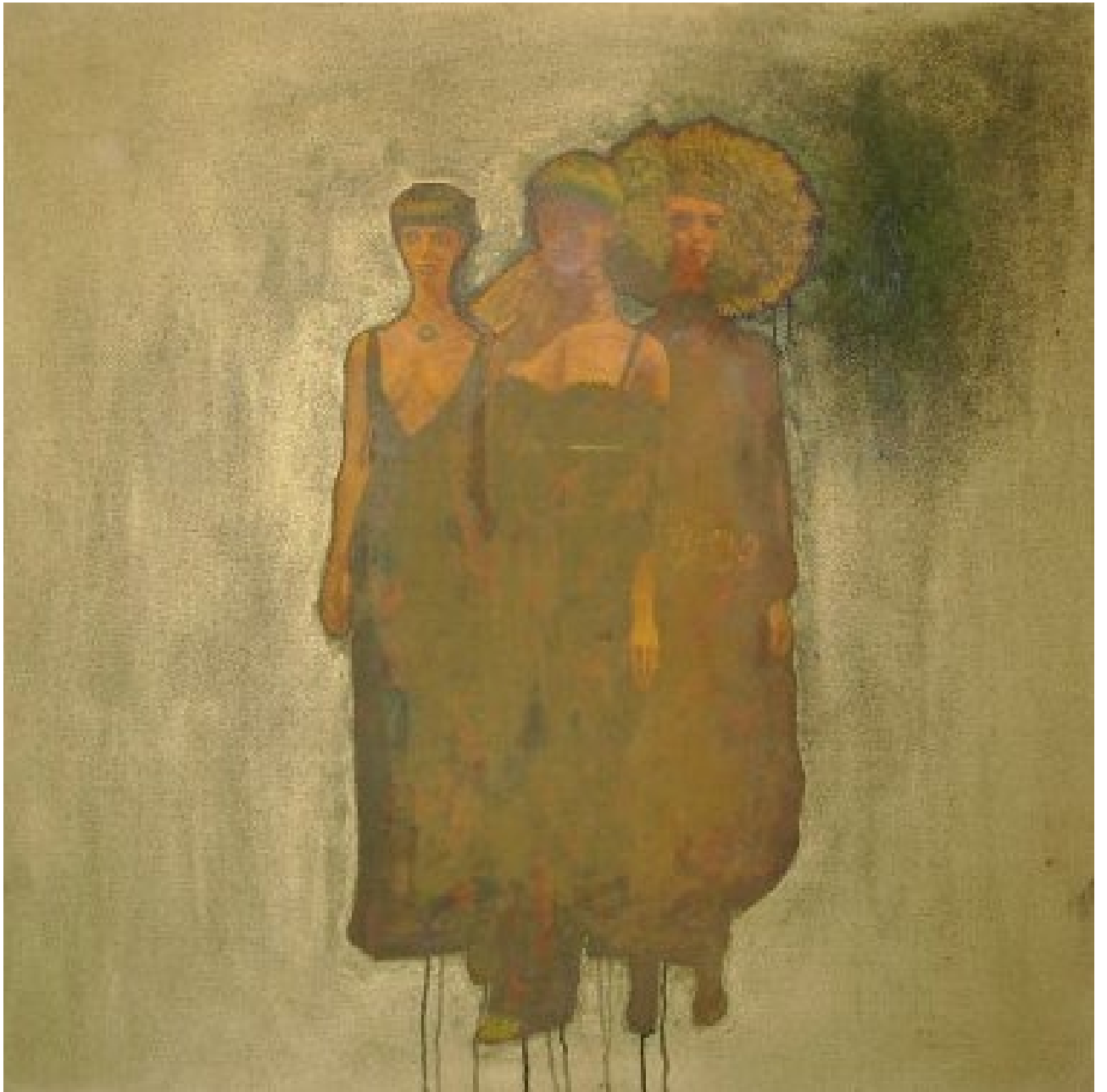
Modèles huile sur toile 100x100cm 2003