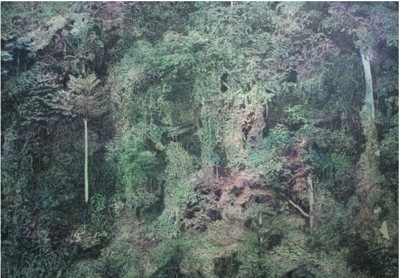
Jungle huile sur toile 239x178cm 2008