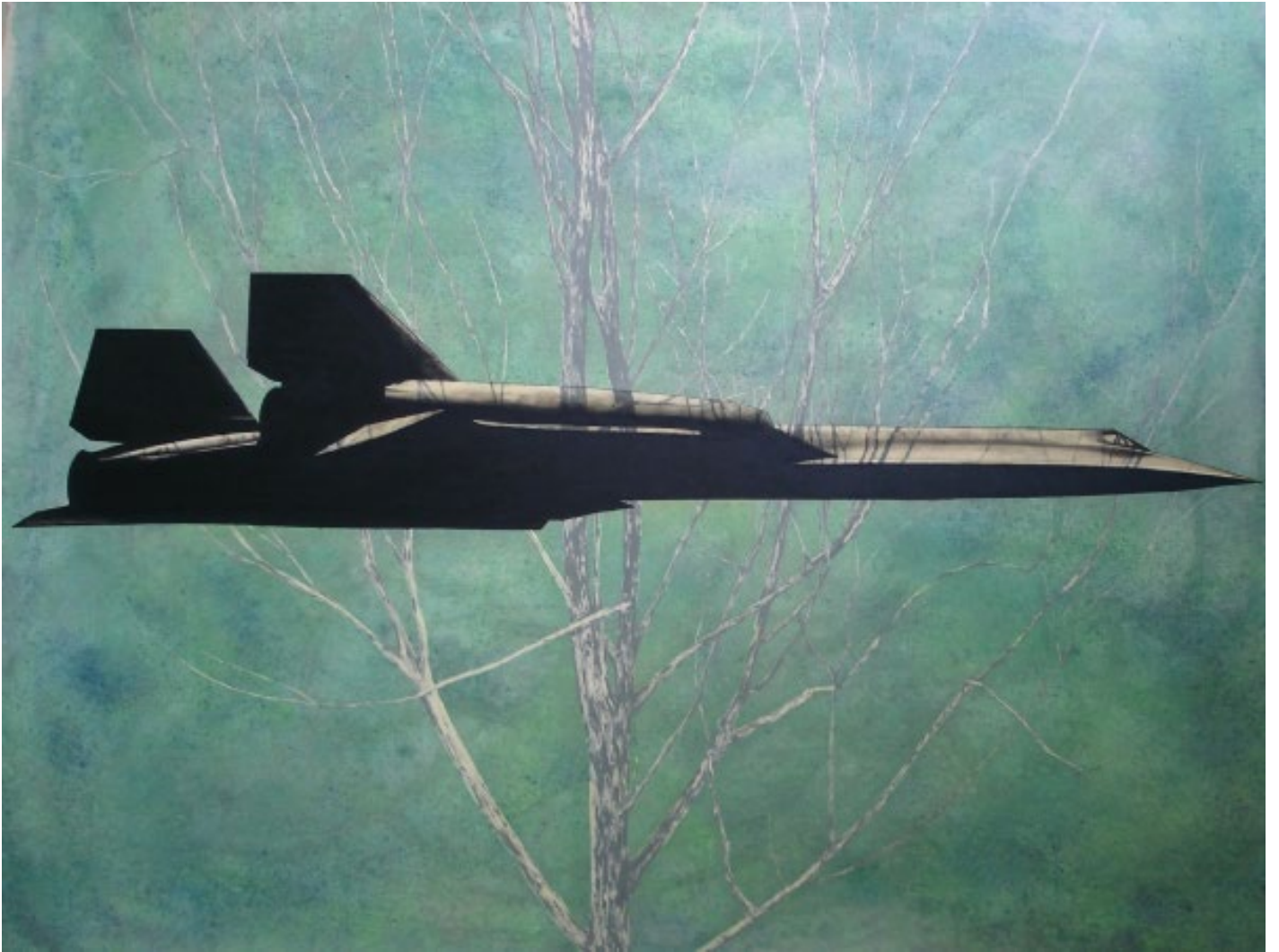
Bird huile sur toile 229x188cm 2008