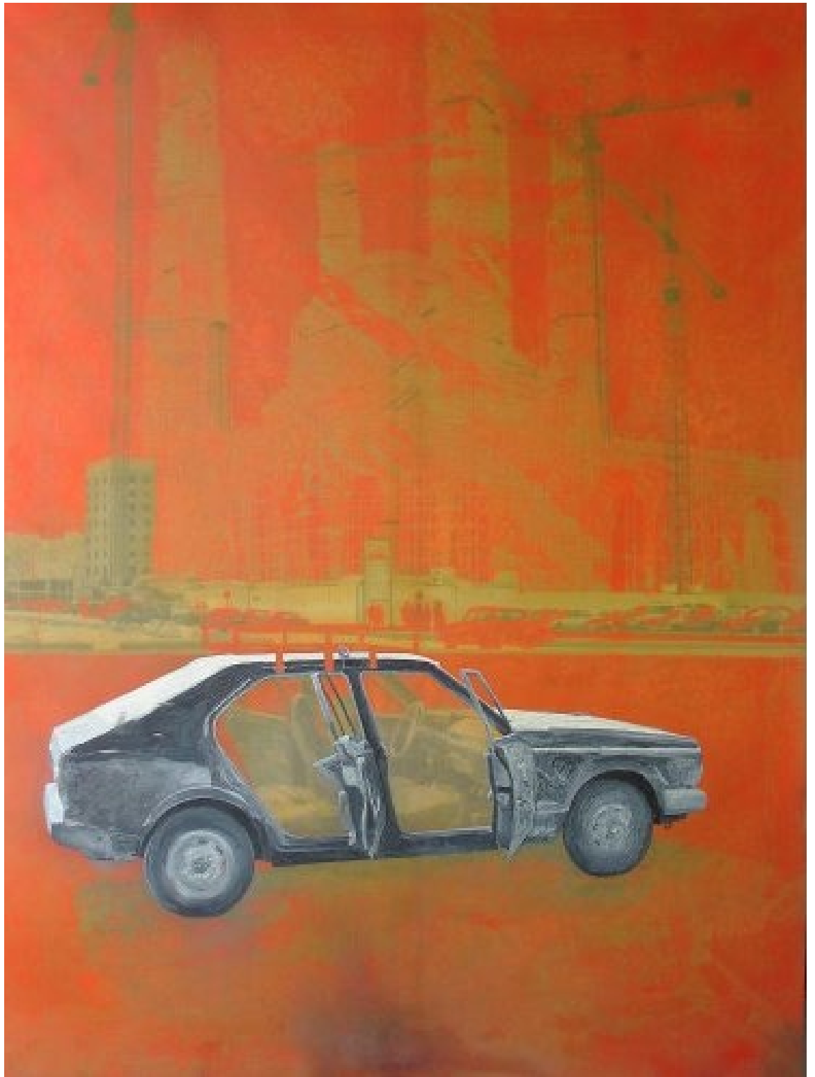
Beirut huile sur toile 180x240cm 2003