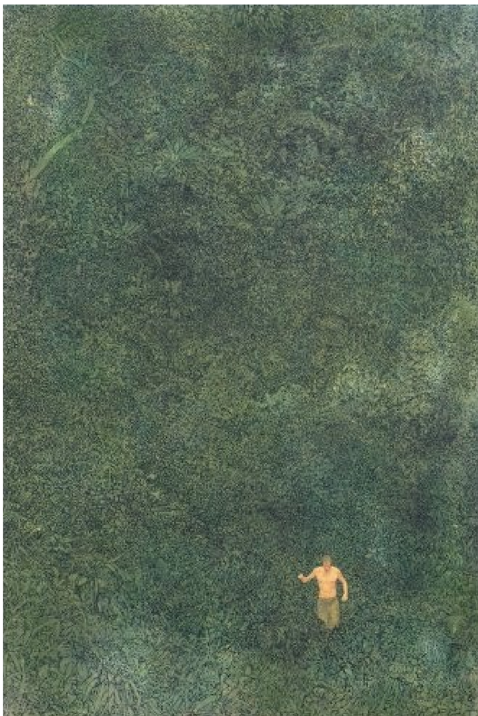
Acomat 1 huile sur toile 97x146cm 2009