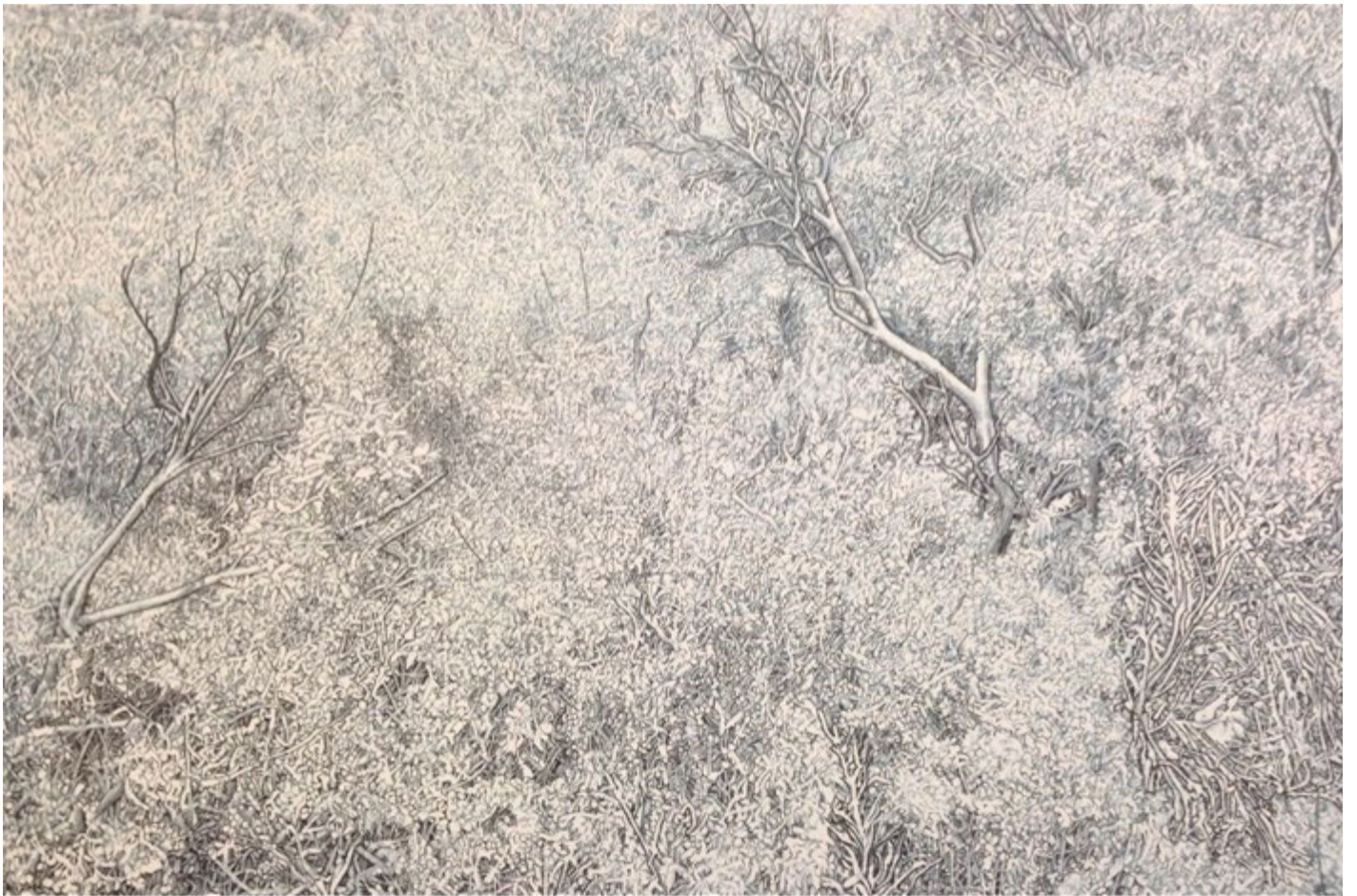
Le Marquis indigo huile sur toile 97x65cm 2014