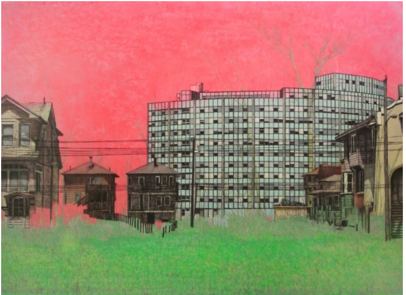
Yellow Trees huile sur toile 193x130cm 2008