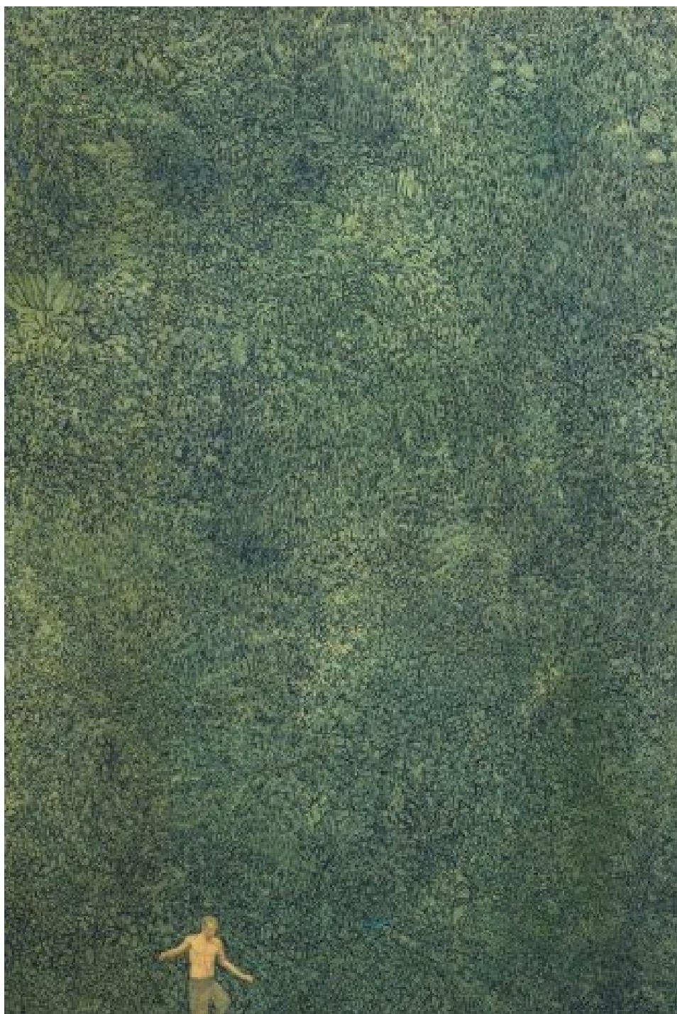
Acomat 2 huile sur toile 65x97cm 2009