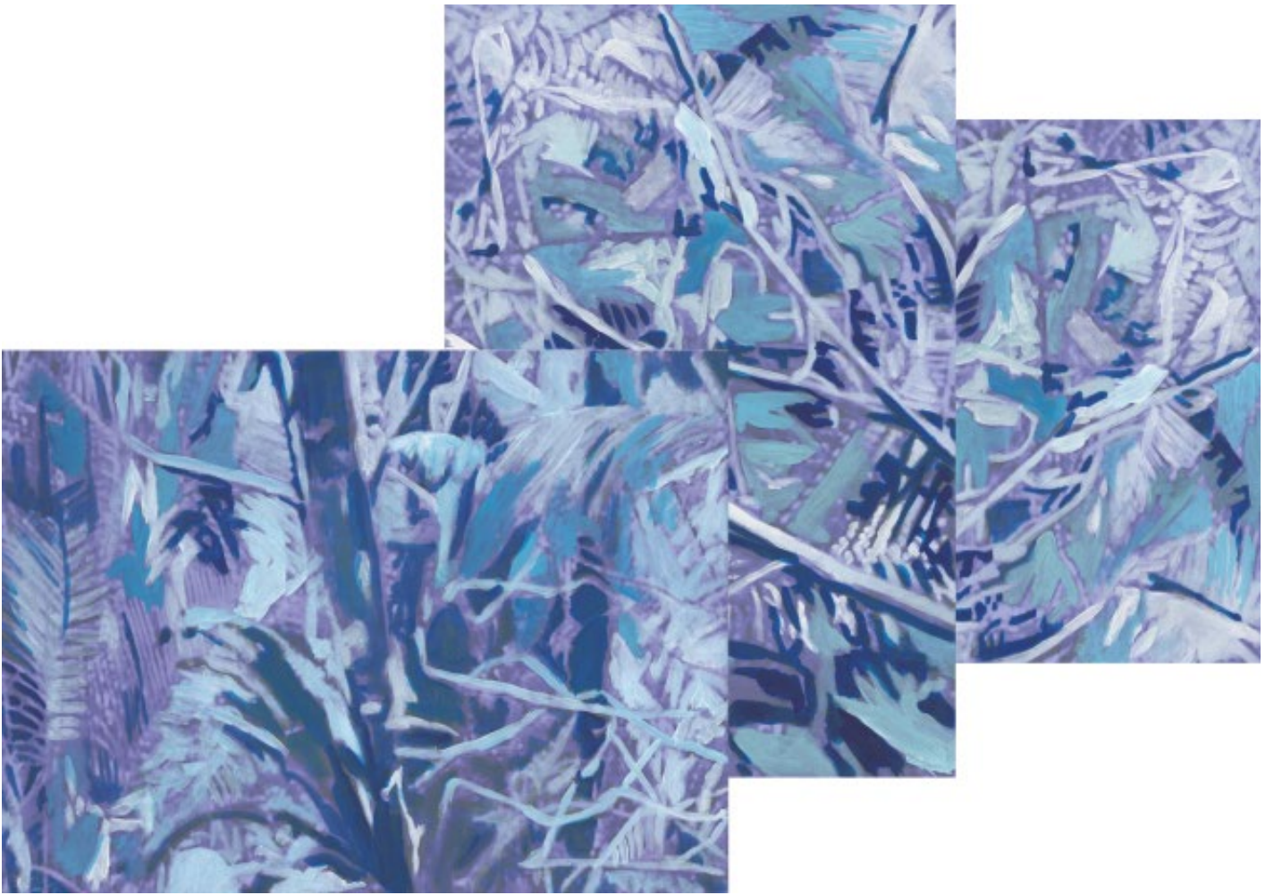
Etude pour forêt huile sur feuilles A4 dimensions variables 2016