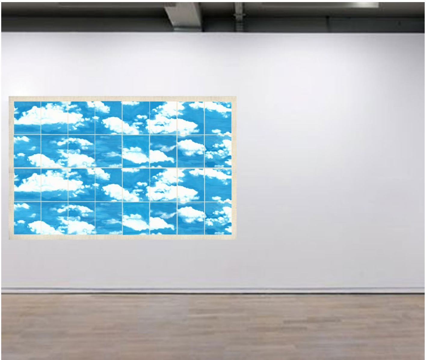
Ciel huile et jet d'encre sur feuillets A4 vue de l'exposition Bad Seeds II 2014