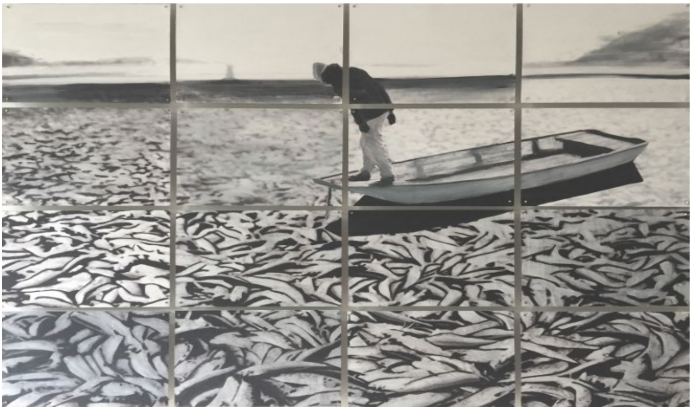
La pêche huile et jet d'encre sur feuilles A4 119x84cm 2015