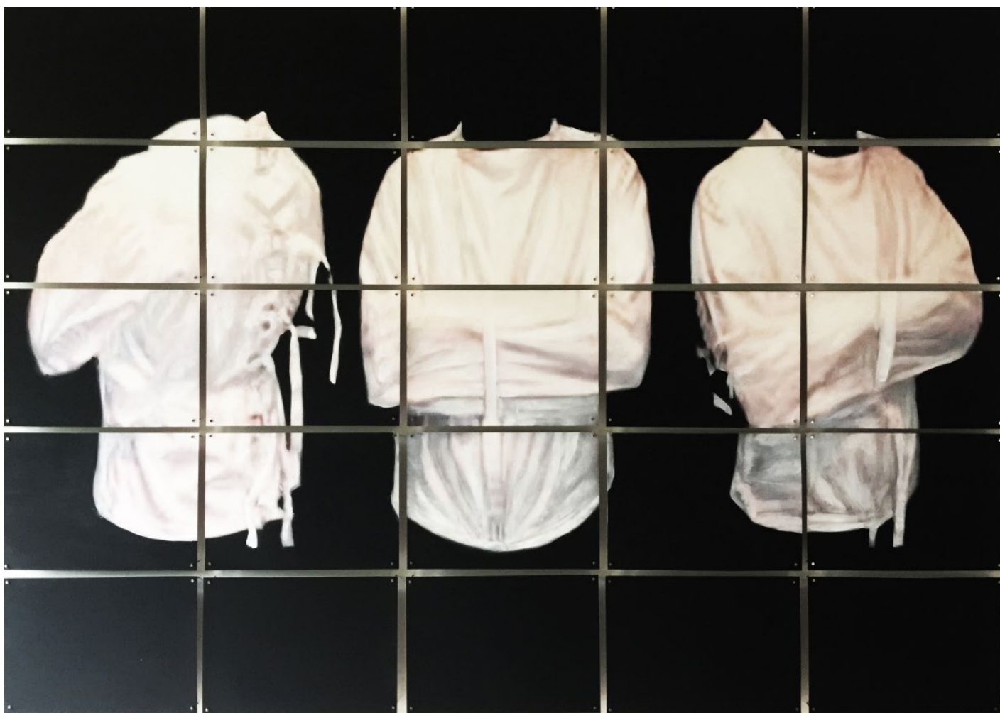
Camisoles huile et jet d'encre sur feuilles A4 148x105cm 2015