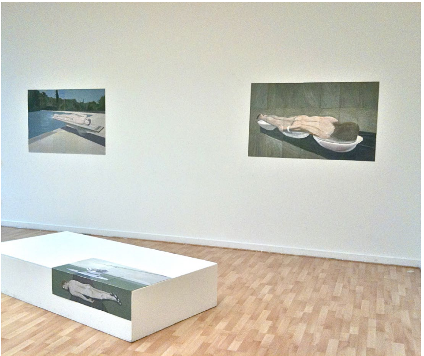
Série des Layings huile et jet d'encre sur feuilles A4 vue de l'exposition Bad Seeds II 2014