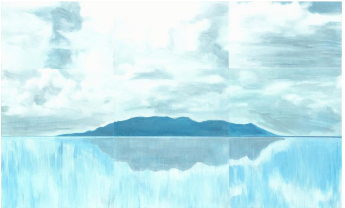
Tant va la cruche à l'eau huile sur feuilles A4 90x63cm 2016