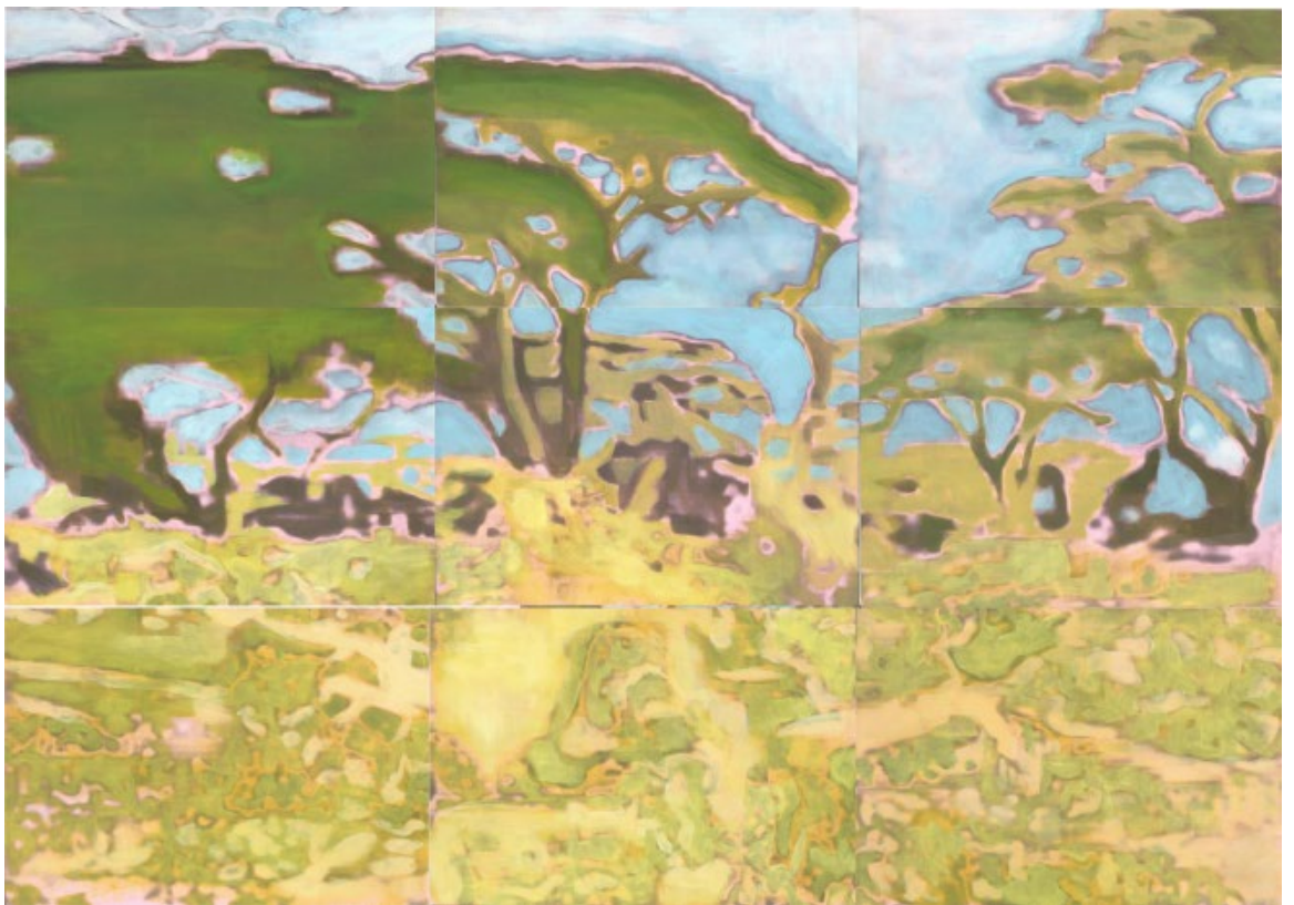
Impressions d'Afrique huile et jet d'encre sur feuilles A4 90x63cm 2016